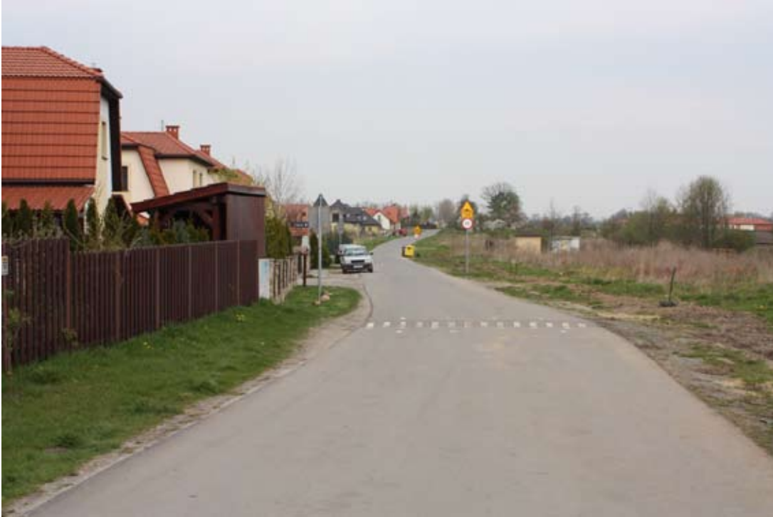
Nakładki bitumiczne w Bielanych Wrocławskich

Ryszard Pacholik - Dodajmy, że na podstawie opinii i uwag mieszkańców tych miejscowości naszej gminy, w których położono już nakładki bitumiczne (Bielany Wrocławskie, Ślęza, Wysoka, Do-