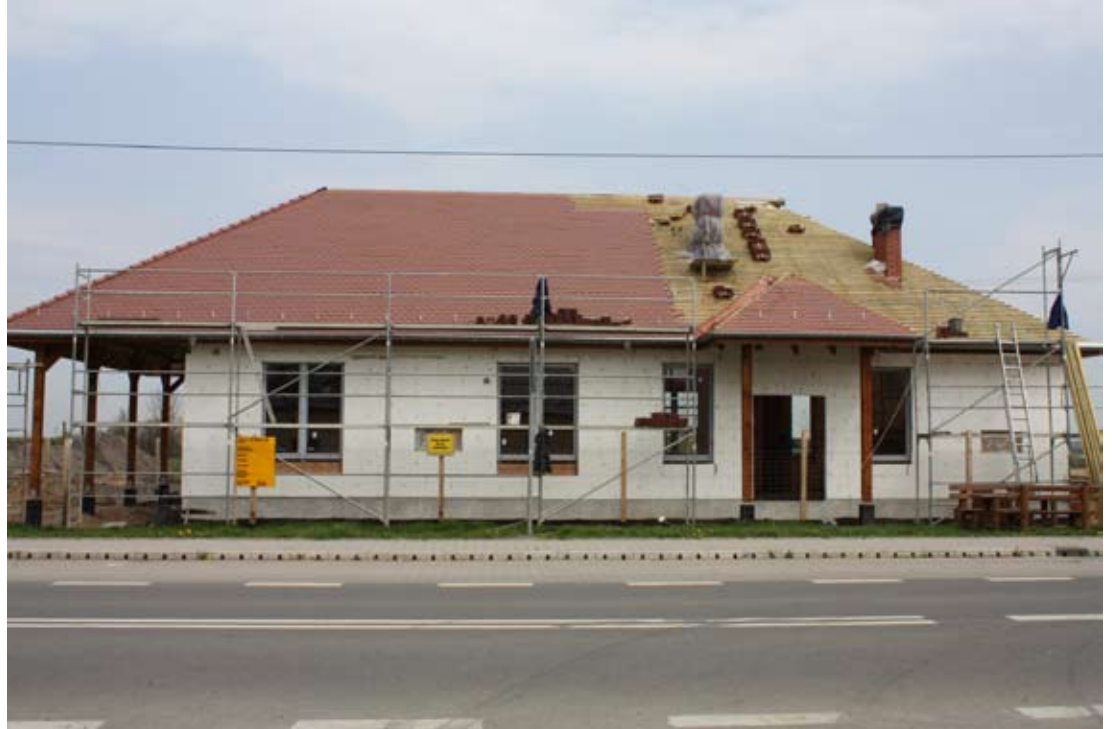
Budowa świetlicy w Szczepankowicach