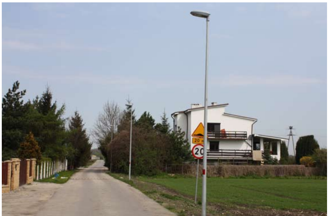
Oświetlenie ulic w Wierzbicach