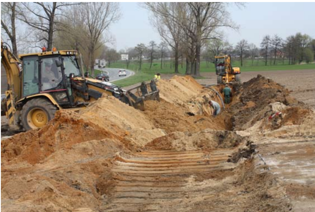
Budowa kanalizacji w Rolantowicach