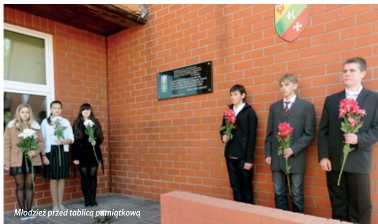
Młodzież przed tablicą pamiątkową

4 października 2013 roku w kobierzycyckim gimnazjum odbyła się uroczystość z okazji pierwszej rocznicy nadania szkole imienia Zesłańców Sybiru.