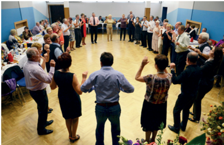
Wspólna zabawa z okazji jubileuszu