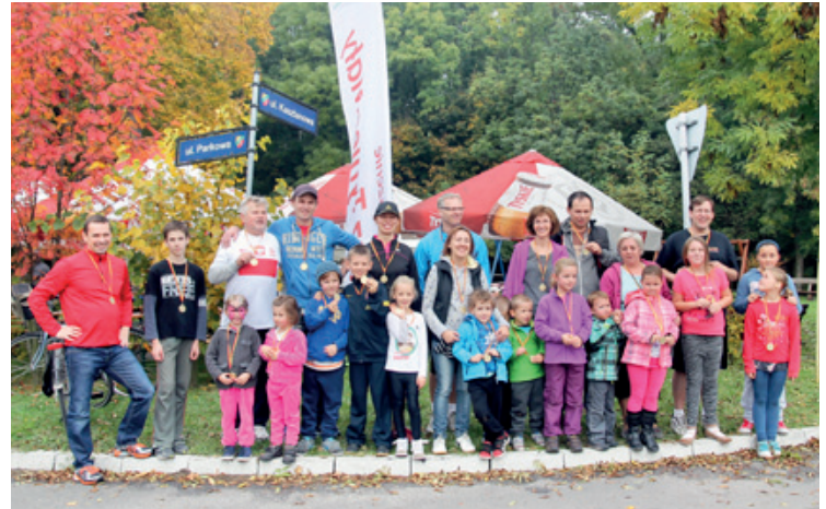
Pamiątkowe zdjęcie uczestników biegu

Druga edycja święta pieczonego ziemniaka na Zielonym Dołku w Tyńcu Małym przypadła na sobotę, 12 października. Festyn rozpoczął się od biegu rodzinnego na dystansie około kilometra, w którym uczestniczyło 30 osób. Najmłodszy biegacz miał trzy latka, najstarszy ponad sześćdziesiąt. Nie było zawodów o zwycięstwo, wszyscy uczestnicy biegu otrzymali pamiątkowe medale oraz dyplomy. Po zakończonym biegu rozpoczęły się konkursy i zabawy z nagrodami dla dzieci, prowadzone przez Loopy's World - głównego sponsora imprezy. Największą atrakcją dla wszystkich było pieczenie ziemniaka. Panie ze stowarzyszenia „Nasz Tyniec