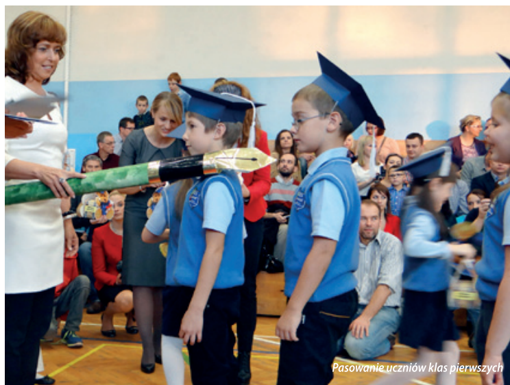
Pasowanie uczniów klas pierwszych