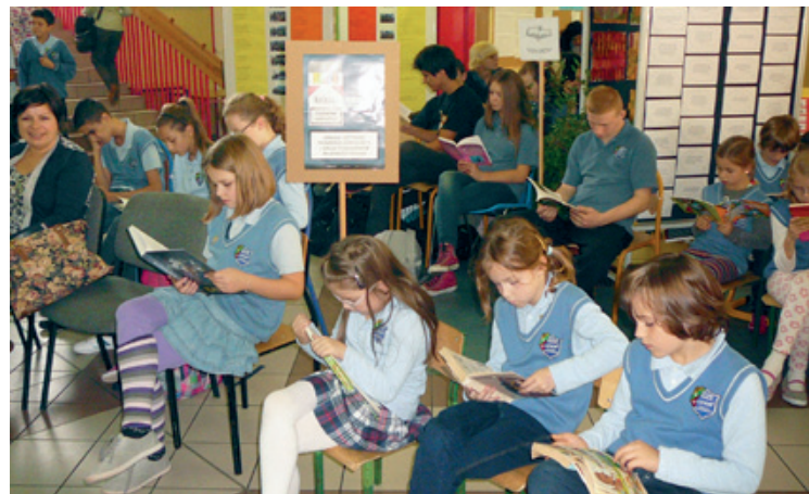
Wspólne czytanie w GZS w Bielanych Wrocławskich

ścienną informującą o organizowanym święcie oraz tablicę, na której prezentowaliśmy odpowiedzi nauczycieli i uczniów na pytanie: „Dlaczego lubisz czytać książki?”. Przygotowaliśmy również cukierkowy poczęstunek i psychozabawę pt. „Jaką książkę zabrałbyś na bezludną wyspę?”. Biblioteka przygotowała również ciekawą wystawę „Nowości książkowych”, która