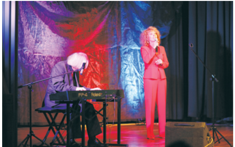
Alicja Majewska i Włodzimierz Korcz

Wielki finał IX edycji Koncertów Ziemi Wrocławskiej odbył się w niedzielę 13 października 2013 o godzinie 19.00 w Sali Widowiskowej Gminnego Centrum Kultury i Sportu w Kobierzycach. Było to niesamowite wydarzenie, które przyciągnęło wielu słuchaczy.