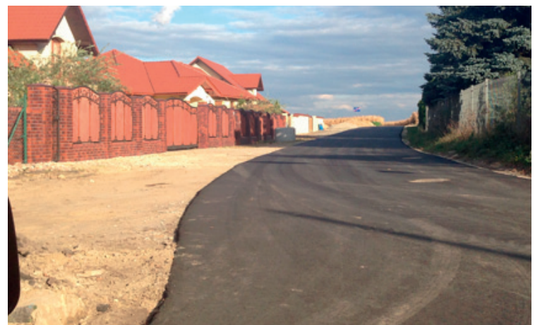
Żurawice, ulica Kasztanowa