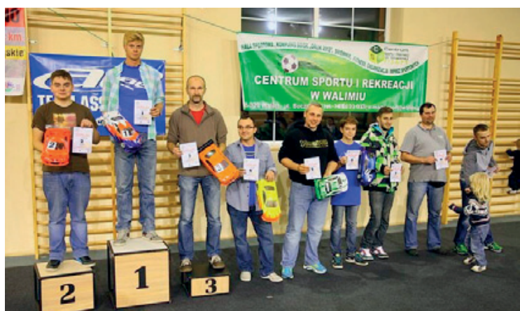
Na podium w Walimiu

należą się również dla organizatorów, którzy kolejny raz stanęli na wysokości zadania, i pomimo drobnych problemów technicznych sprawnie przeprowadzili zawody. Wiemy, że zawiesili nam wysoko poprzeczkę, gdyż kolejna eliminacja cyklu PMMSRC odbędzie się 16 listopada br. w Hali Sportowo-Widowiskowej w Kobierzycach. W zawodach zadebiutuje kilku młodych zawodników, którzy skrupulatnie przygotowują się do tego ważnego wydarzenia w ramach zajęć modelarskich prowadzonych w budynku GCKiS. Zapraszamy kibiców i gwarantujemy duże emocje. Łukasz Kaczmarczyk