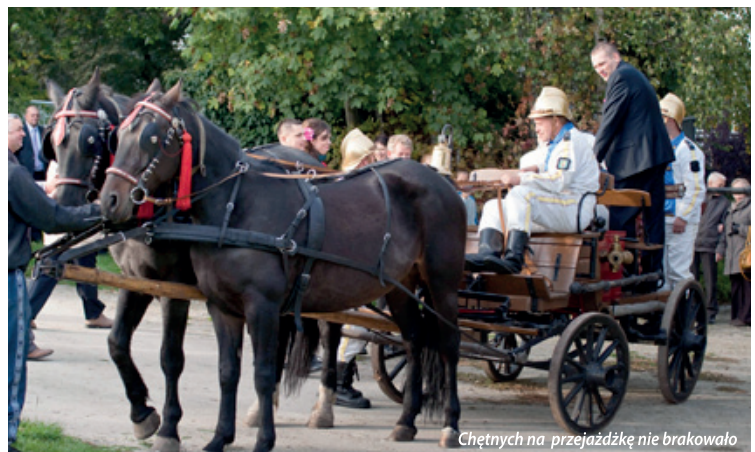
Chętnych na przejażdżkę nie brakowało

Joanna Stasiewicz Stowarzyszenie Nasz Domasław