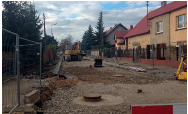
Kobierzyce, przebudowa ulicy Sportowej i Spółdzielczej