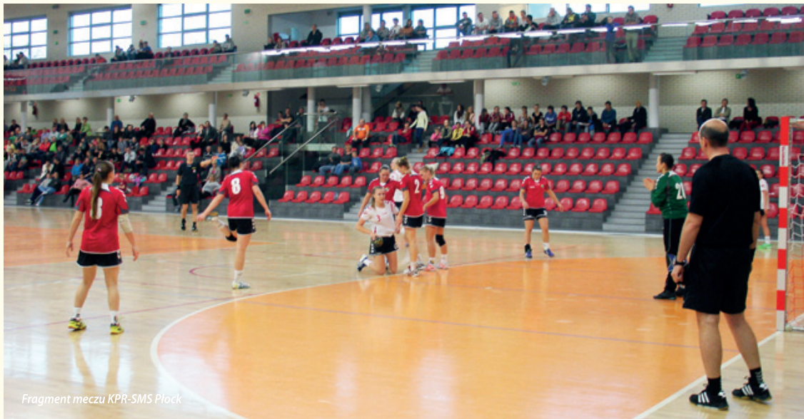
Fragment meczu KPR-SMS Płock