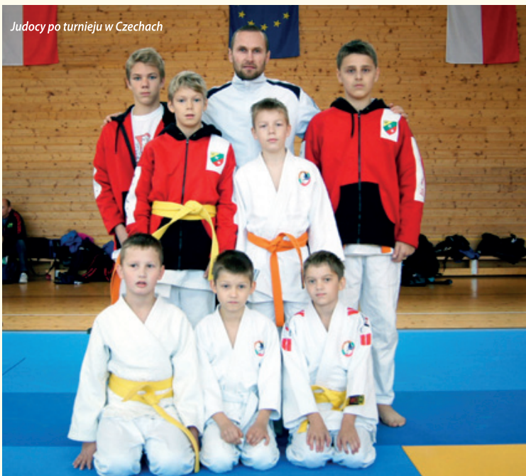
Judocy po turnieju w Czechach

W Szkole Podstawowej w Bielanych Wrocławskich powstała sekcja mini piłki siatkowej dziewcząt w ramach Uczniowskiego Klubu Sportowego „Bielik”. Młode zawodniczki klubu mogły zaprezentować swoje umiejętności na pierwszych zawodach w sezonie, które odbyły się 28 września w Strzegomiu. Organizator turnieju „Młoda Gwardia” rozpoczął tam II edycję Volleymanii Dolny Śląsk. 175 dziewczyn z klas IV - VI szkół podstawowych naszego województwa rywalizowało o Puchar Burmistrza Strzegomia. Nasze dziewczęta ry-