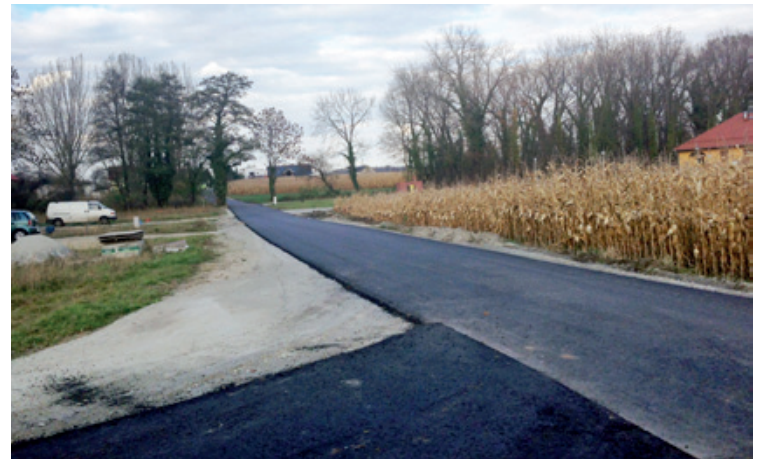
Wierzbice, ulica Tarnopolska