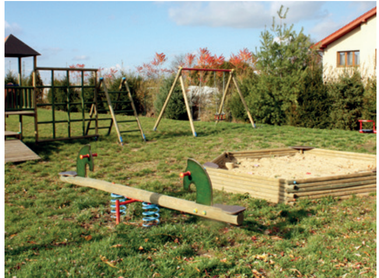
Plac zabaw w Owsiance