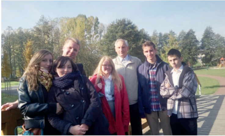
Wizyta w Czechach